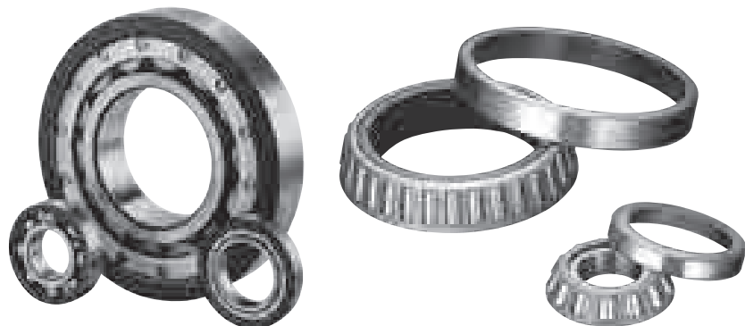
Ložiska pro trakční motory